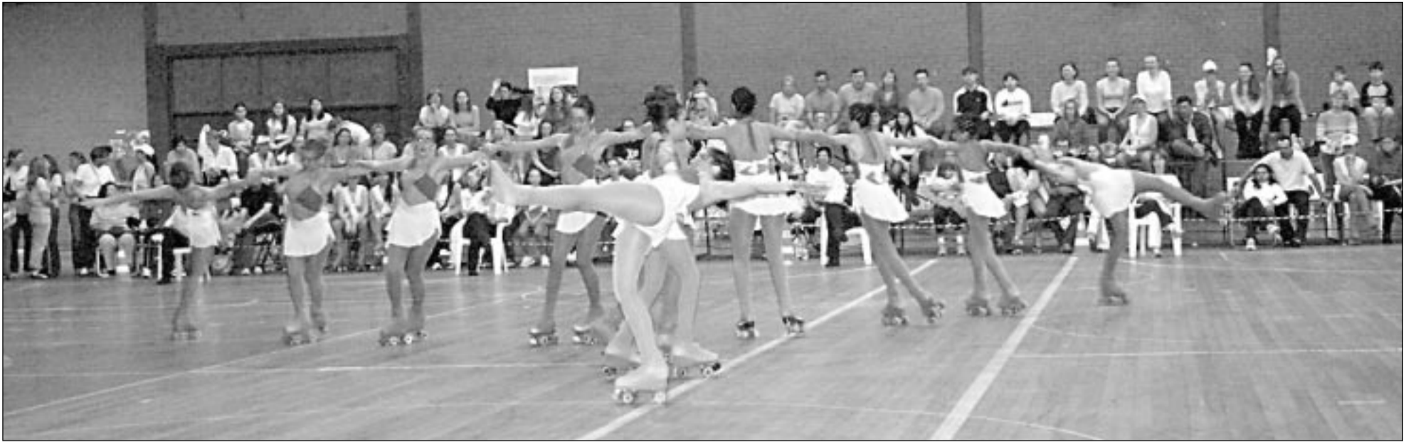
Coreografias diversas chamaram a atenção do público