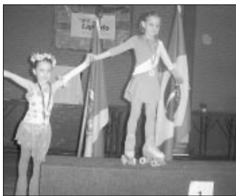
Jovens foram premiados em diversas categorias