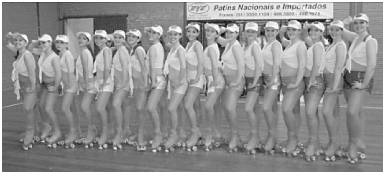
Meninas de Lajeado exibiram talento sobre patins