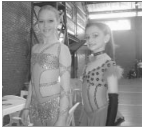
Atletas desfilavam modelitos requintados