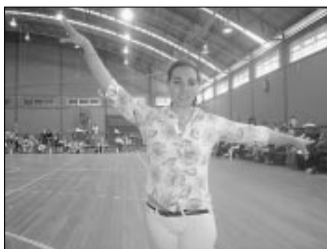
Técnica argentina sentiu-se bem acolhida pelos brasileiros

apresentações no programa longo, que dura até quatro minutos.