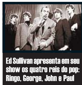
Ed Sullivan apresenta em seu show os quatro reis do pop: Ringo, George, John e Paul

No dia 9 de fevereiro de 1964, às 20 horas, os Beatles estavam se apresentando no Ed Sullivan Show, em Nova York (Estados Unidos) e por consequência o resto do mundo ocidental mais o Japão, estavam entrando na Beatlemania. As botinhas de salto para os rapazes e os ternos (calça, colete e casaco) com as calças bem apertadas, a gravata fina mais os bonés usados por John e Ringo eram a moda do momento.