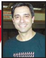
Mesmo sem patrocínio, resolvemos encarar o desafio Léo Bengochéa

O espetáculo também conta com coordenação coreográfica de Mauro Schneider e Neca Carrasco. Na pista patinadores de 3 a 61 anos apresentando em uma hora e meia um pouco do que foi desenvolvido durante o ano. Apoio do Pio XII, A Federação Gaúcha de Patinação (FGP), Controller, Iworks, Fit, Celsom, Móveis Piratini, Borracha Hewer, Cesart Comunicação, Clínica Audiomed, Rye Sports, D’Calsing Joias, MEB Party, Urbana, Ondazul Piscinas, Prefeitura e Rogério Reichert.